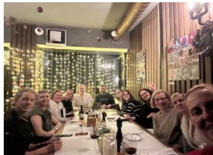
Fête de fin d'année Comité-Equipe le 18 décembre 2025